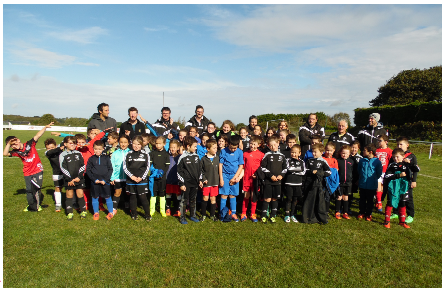
Une partie de l'effectif après l'entraînement du samedi à Plounérin.